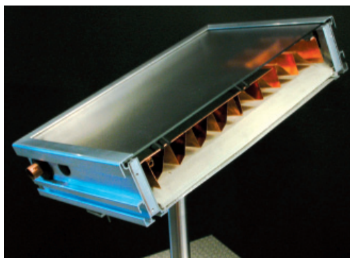
Abb.1 Hybrid-Kollektor WPK

Ziel der Koppelung beider Technologien ist die Bereitstellung von Warmwasser und Heizungswärme mit einer wesentlich größeren Energieeinsparung, als dies bei heizungsunterstützenden Solaranlagen oder Wärmepumpen allein möglich ist. Allerdings schien eine solche Kombination wegen der unterschiedlichen Arbeitsweisen beider Systeme bisher unmöglich. Das Problem: Die Koppelung einer Solaranlage mit einer Wärmepumpe würde deren Rücklauftemperatur steigern und gleichzeitig deren Arbeitszahl senken, während die